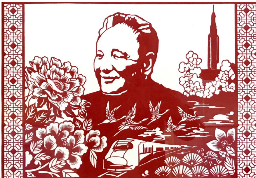
纪念改革开放 40 周年